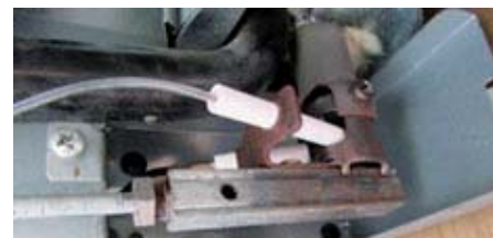
Photo d'un brûleur avec son cache et

Faites contrôler le brûleur du réfrigérateur (possibilité d'un cocon)