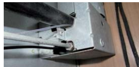
sans son cache

Le brûleur est situé à l'arrière du réfrigérateur, en partie basse, il est protégé par un carénage qui le protège du vent et récupère les suies incandescentes qui peuvent se décrocher de la cheminée d'évacuation des gaz brûlés. Le brûleur est composé de deux électrodes. Une, qui génère les étincelles et l'autre qui contrôle la présence de la flamme.